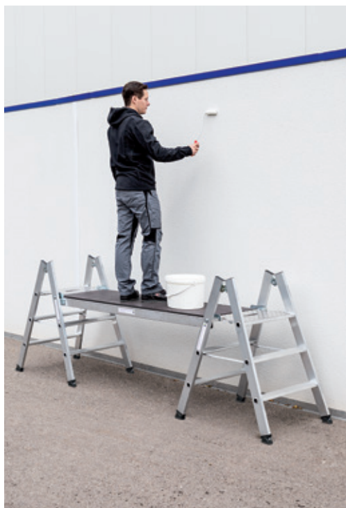
Abb. Bestell-Nr. 50183 (2 St.) mit 50188