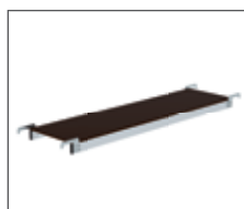
Einhängeplattform in zwei Längen