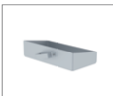
Ablageschale Bestell-Nr. 50187